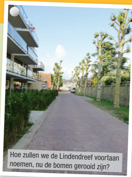
Hoe zullen we de Lindendreef voortaan noemen, nu de bomen gerooid zijn?

Ondertussen heeft schepen Sticker uit de tussenkomsten van de N-VA-raadsleden de nodige lessen getrokken. In een bouw dossier dat momenteel voorligt, wordt onmiddellijk een correcte marktwaarde bepaald voor mogelijk te rooien bomen. Dit voorkomt discussies daarover achteraf. Voor de N-VA blijft nog één vraag over: hoe moeten we de Lindendreef noemen als alle lindebomen verdwenen zijn?