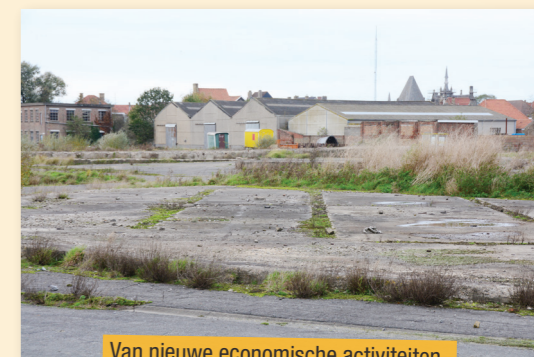
Van nieuwe economische activiteiten is hier nog weinig te merken.

In tweede instantie moet de stad ook de bouw van woningen in gang steken. De resterende ruimte invullen met volkstuinjes vindt de N-VA een goed initiatief.