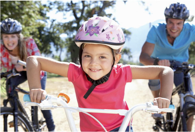
▲ De N-VA pleit voor degelijke fietsinfrastructuur, met onder meer een fietsbrug over de drukke Vaartstraat.

De verdere ontwikkeling van onze stad brengt uitdagingen met zich mee, vooral op gebied van mobiliteit en verkeersveiligheid. De N-VA pleit er dan ook voor om de nodige investeringen te doen, zoals een fietsbrug over de drukke Vaartstraat en vooral de aanleg van de noordelijke ring.