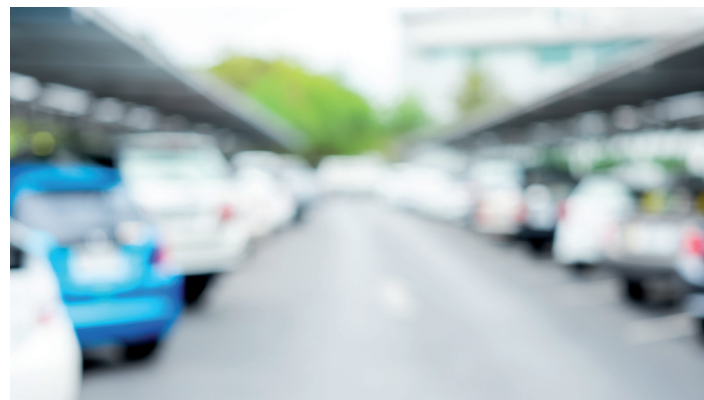
▲ Inwoners van Veurne moeten twee keer betalen voor de parking.

Tijdens de piekmomenten - denk aan weekends, avondje Veurne Kermis, Boeteprocessie, Koekezonntag - zal deze parking dus steeds betalend zijn. Maar ook onderwijzend personeel van de nabijgelegen school of mensen werkzaam in de binnenstad zullen voor 10 uur niet gratis gebruik kunnen maken van deze randparking.