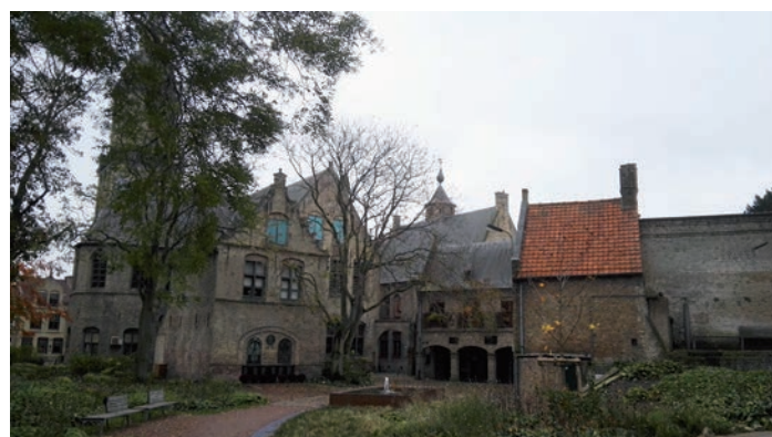
▲ Vanuit het stadspark hebt u een prachtig zicht op enkele erfgoedparels: het Landhuis, de Belforttoren en het Stadhuis.